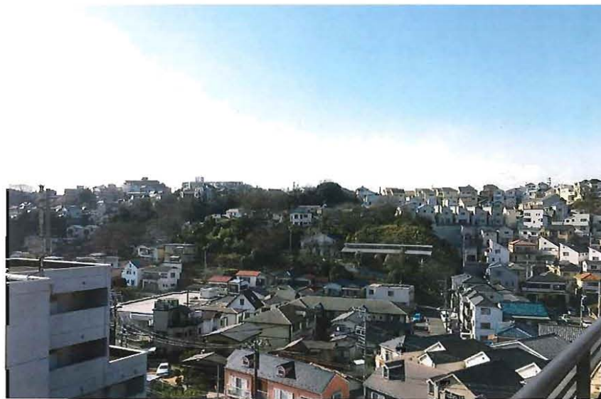
南西向き・開放感溢れるお部屋です。