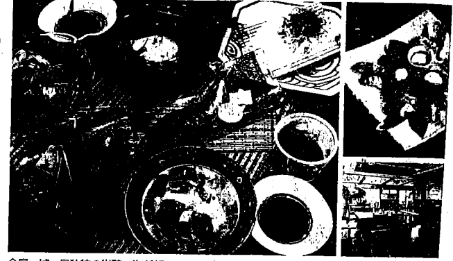
全席、城ヶ島独特の絶景の海が望めるテーブルとテラスで、お食事やお酒が楽しめます。

TEL 046-884-8551 三浦市三崎3-2-22 16:00~23:00(22:30ラストオーダー) 水曜日 京浜急行「三崎口駅」よりバスにて15分(「三崎港」バス停下車) igasaki.com/kura/